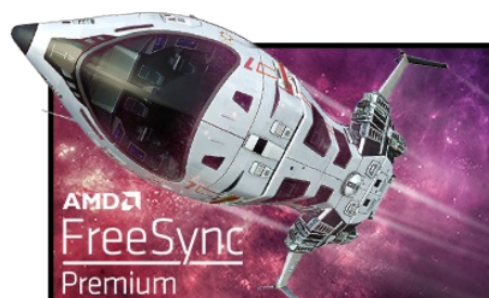
Technologie FreeSync™ Premium

La dalle en technologie Fast IPS à 240 Hz garantit des scènes de champ de bataille vives, haute fidélité d'affichage avec des couleurs exceptionnellement précises et offre un temps de réponse d'image animée (MPRT) époustoufflant de 1 ms.