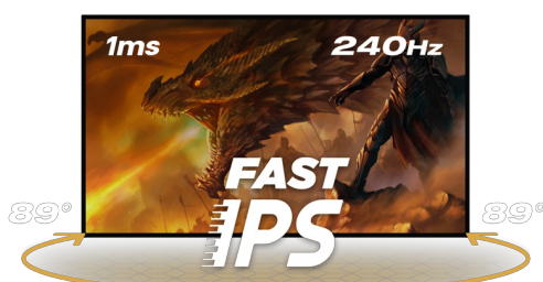
240Hz & 1ms MPRT

La dalle en technologie Fast IPS garantit une superbe qualité d'image, et la possibilité de régler la luminosité et les nuances sombres avec la fonction Black Tuner offre de meilleures performances de visualisation dans les zones ombragées. Pour assurer le confort pendant les sessions de jeu marathon, vous pouvez facilement ajuster la position de l'écran selon vos préférences grâce au support réglable en hauteur.