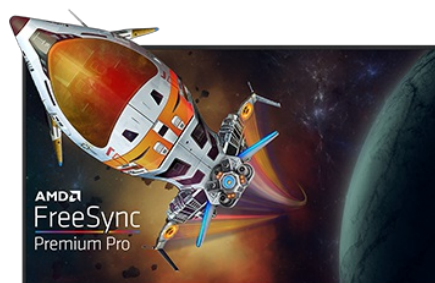
TECHNOLOGIE FREESYNC™ PREMIUM PRO

La dalle Fast IPS garantit non seulement des scènes de champ de bataille vives et de haute fidélité affichées avec une précision de couleur exceptionnelle, mais elle offre également un temps de réponse d'image en mouvement (MPRT) exceptionnel de 0.5 ms.