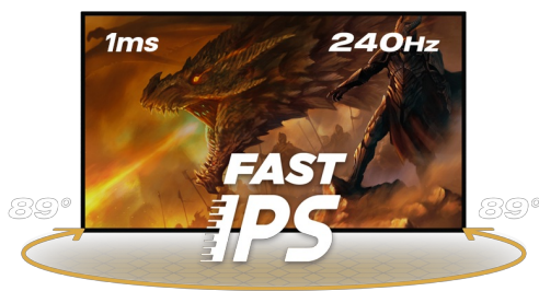
240Hz & 1ms MPRT

La dalle en technologie Fast IPS garantit une superbe qualité d'image, et la possibilité de régler la luminosité et les nuances sombres avec la fonction Black Tuner offre de meilleures performances de visualisation dans les zones ombragées. Pour assurer le confort pendant les sessions de jeu marathon, vous pouvez facilement ajuster la position de l'écran selon vos préférences grâce au support réglable en hauteur.