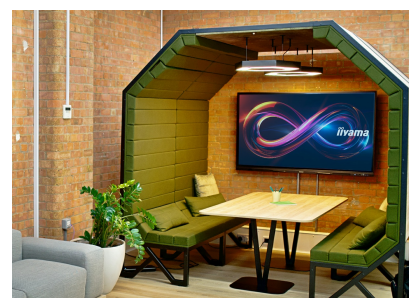
Espacios de Reunión

Las pantallas táctiles interactivas 4K son la clave para experiencias interactivas inmersivas para el diseño espacial de tiendas. Permita que los clientes exploren su sitio web allí mismo y luego o interactúen con una variedad de aplicaciones creativas o experienciales que desea alojar. La flexibilidad de los modos horizontal o vertical con operación 24/7, incorporada Android y MediaPlayer hacen de las pantallas de la serie una de las soluciones de pantallas táctiles más adaptables que existen.