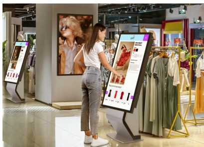
Installations de Vente au Détail

Avec l'application EShare , vous apportez une idée sans effort et une collaboration efficace dans votre entreprise ou votre école. Vous pouvez commencer à partager sans fil plus facilement que jamais.