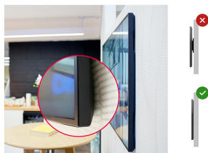
Zero-Gap Wall Mount

Designed to perform in continual, around the clock environments, the LH6570UHB can be installed and utilised in landscape and portrait orientation. The jaw dropping and best-in-class 35mm total depth (when used with the included proprietary brackets) will mean this display can be installed discreetly and elegantly in all areas.