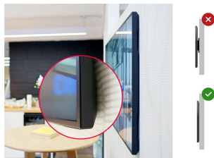
Zero-Gap Wall Mount

Designed to perform in continual, around the clock environments, the LH5070UHB can be installed and utilised in landscape and portrait orientation. The jaw dropping and best-in-class 30mm total depth (when used with the included proprietary brackets) will mean this display can be installed discreetly and elegantly in all areas.