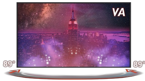
VA TEHNOLOGIJA PANELA

Brzo vreme odziva ključno je za glatko igranje. Ono smanjuje ghosting i razmazivanje slike, a korisniku pruža bogato iskustvo uz poboljšane performanse.