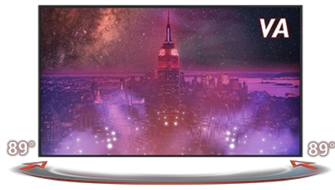
VA TEHNOLOGIJA PANELA

Brzo vreme odziva ključno je za glatko igranje. Ono smanjuje ghosting i razmazivanje slike, a korisniku pruža bogato iskustvo uz poboljšane performanse.