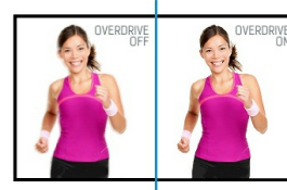
OverDrive ON / OFF

La tecnología infrarroja utiliza retroiluminación infrarroja. Un toque se registra con gran precisión cuando la luz infrarroja se bloquea con el dedo o el lápiz. Esta tecnología no se basa en una superposición o sustrato, por lo que es imposible "desgastar" físicamente la pantalla táctil.