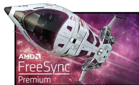
Technologie FreeSync™ Premium

La Résolution UHD (3840 x 2160), plus connu sous la dénomination 4K, vous offre une zone d'affichage gigantesque avec 4 fois plus d'espace d'information et de travail qu'un écran classique en Full HD. En raison de sa haute densité de points par pouce (DPI), il affichera des images incroyablement fines et pointues.