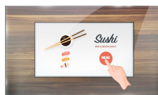
Тач через стекло

IPS дисплеи известны своими широкими углами обзора, естественными цветами и точной цветопередачей. Они особенно хорошо подходят для приложений по работе с цветом.