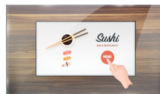
Tocco attraverso vetro

Questa tecnologia si avvale di una griglia di sensori composta di fili micro sottili, integrata nel vetro che riveste lo schermo. Posizionando il dito sul vetro, le caratteristiche elettriche della griglia di sensori variano e quindi viene rilevato il tocco. Grazie al rivestimento in vetro, questa tecnologia non si danneggia con il tempo e la funzione touch rimane inalterata anche in caso di vetro graffiato. Offre una perfetta qualità delle immagini e funziona con il dito umano (anche se la mano indossa dei guanti in lattice) e con la stilo magnetica.