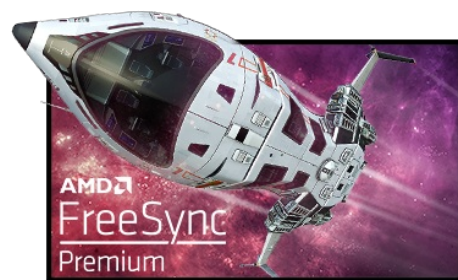
Tecnología FreeSync™ Premium

El panel Fast IPS garantiza no solo escenas de campo de batalla vívidas y de alta fidelidad que se muestran con una precisión de color excepcional, sino que también proporciona un tiempo de respuesta de imagen en movimiento (MPRT) de 0.8 ms.