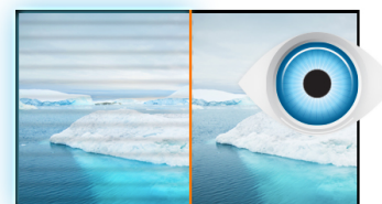
Flicker free + Blue light

Grazie a una risoluzione di 1920 x 1080, il monitor è in grado di riprodurre immagini ad alta definizione. Ciò significa che sullo schermo si possono visualizzare più informazioni; ad es., il 60% in più rispetto al monitor 1280 x 1024.