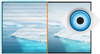
Flicker free + Blue light

Il ProLite B2483HSU è un eccellente Monitor Full HD da 24", retroilluminato a LED, con una risoluzione 1920 x 1080p. Caratterizzato da un tempo di risposta da 1 ms e un rapporto di contrasto avanzato di 80 000 000 : 1, assicura così una qualità dell'immagine chiara e vibrante, con un contrasto elevato. Un supporto triplo di connessione, garantisce la compatibilità di installazione con le più recenti schede grafiche e Notebook. Il supporto ergonomico dello schermo offre una regolazione in altezza di 13 cm. Un perno girevole e inclinabile, rende questo schermo adatto ad una vasta gamma di applicazioni e ambienti, in cui la flessibilità e l'ergonomia sul posto di lavoro, sono fattori chiave. Inoltre il monitor ha una certificazione TCO e Energy Star. Una soluzione perfetta per l'istruzioni educativi, uffici, imprese e i mercati finanziari.