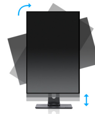
HAS + Pivot

La soluzione definitiva per il comfort e la salute degli occhi. I monitor Flicker free con la funzione Blue light reducer sostanzialmente riducono lo sforzo e l'affaticamento causato dallo sfarfallio e dall'emissione di luce blu dei monitor normali.