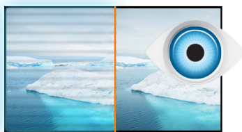
Flicker free + Blue light

Ook verkrijgbaar met een vaste monitorvoet: ProLite E2483HSU-B5 en in het wit: ProLite B2483HSU-W5