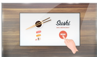
Touch durch Glas

Der ProLite TF1515MC-B2 (38 cm) verwendet die PCAP-Touch-Technologie und ist verbaut in einem formschönen Edge-to-Edge Glas Design. Dank seiner Glasauflage und dem robusten Rahmen garantiert der Bildschirm eine hohe Haltbarkeit und Kratzfestigkeit und ist somit ideal für Kiosksysteme und Anwendungen im öffentlichen Einsatz geeignet. Ausgestattet mit einer Schaumstoffdichtung bietet das Gerät eine nahtlose Integration in Kiosksysteme. Mit der IP65 Zertifizierung bietet das Gerät eine Staub- und Wasserresistenz in der Bedienung. Die Ausrichtungsoptionen Quer- und Hochformat sorgen für flexible Montagemöglichkeiten. Der TF1015MC-B2 kann mit separat erhältlichen Befestigungswinkeln ausgestattet werden ( OMK2-1 ), die den Einbau erleichtern. Die ideale Lösung für Kiosksysteme, industrielle Umgebungen, Kontrollräume und interaktive Multimedia-Anwendungen.