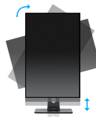
HAS + Pivot

Technologia VA gwarantuje wyższy kontrast, lepsze odwzorowanie barw i większe kąty widzenia niż najbardziej popularna technologia TN. Obraz będzie wyglądał dobrze niezależnie od tego, pod jakim kątem na niego patrzymy.