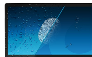
Покрытие против отпечатков пальцев

Благодаря ОС Android вы можете легко настроить дисплей в соответствии с вашими потребностями, установив приложения прямо на него.