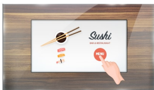
Dotkněte se skla

ProLite TF2415MC-B2 (23.8 inch) používá PCAP dotykovou technologii a je zabudován do okuláru s bez rámečkovým šasi. Díky skleněné vrstvě kryjící obrazovku a robustnímu rámu zaručuje vysokou odolnost a odolnost proti poškrábání, takže je ideální pro kiosky a místa veřejného prostoru. Vybavená pěnovým těsněním, podporuje bezproblémovou montáž do kiosků a zajišťuje stupeň krytí IP65, což vede k odolnosti proti prachu a vodě v přední části obrazovky. Orientace na šířku, na výšku i lícovou stranou zajišťuje flexibilní možnosti montáže téměř v jakékoli instalaci. Pro snadnou montáž a umístění je přístroj TF2415MC-B2 vybaven externími montážními držáky, což je ideální řešení pro integrátory kiosku, průmyslové prostředí, řídicí místnosti a interaktivní multimédia.