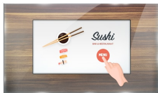
Тач через стекло

The ProLite TF2215MC-B2 (21.5 inch) uses PCAP touch technology and is built into an eye-catching bezel with edge-to-edge glass. Thanks to a glass overlay covering the screen and a rugged bezel, it guarantees high durability and scratch-resistance, making it perfect for kiosk and high use public facing applications. Equipped with a foam seal finish it supports seamless integration into kiosks and provides IP65 rating resulting in dust and water resistance from the front. Landscape, portrait and face-up orientation ensures flexible mounting possibilities in almost any installation. For ease of integration, the TF2215MC-B2 comes equipped with external mounting brackets making it an ideal solution for kiosk integrators, industrial environments, control rooms and interactive multimedia.