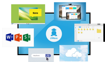
iiWare 8.0 (Android OS)

Delite, strimujte i uređujte sadržaj sa bilo kojeg uređaja direktno na ekranu i transformišite sastanke ili predavanja svog tima u laku, brzu i nesmetanu interaktivnu sesiju sa uključenim WiFi modulom ( OWM001 ) i aplikacijom ScreenSharePro.