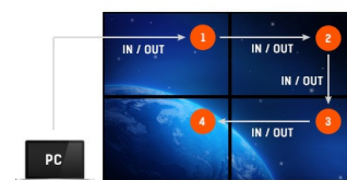
Conexión Daisy Chain

Gracias al sistema operativo Android puede fácilmente personalizar la pantalla según sus necesidades instalando aplicaciones directamente en ella.