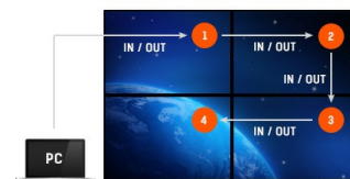
Support en Daisy Chain

Grâce au système d'exploitation Android vous pouvez facilement personnaliser l'affichage en fonction de vos besoins en y installant directement des applications.