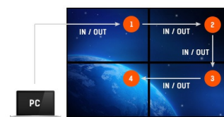
Support en Daisy Chain

Grâce au système d'exploitation Android vous pouvez facilement personnaliser l'affichage en fonction de vos besoins en y installant directement des applications.