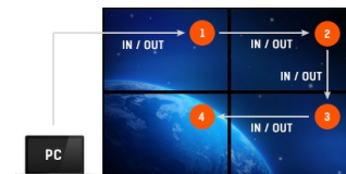
Daisy chain ondersteuning

Dankzij het Android OS kunt u video en andere media bestanden afspelen en uw eigen apps installeren.