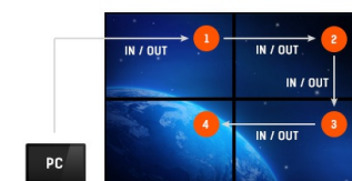
Support en Daisy Chain

Grâce au système d'exploitation Android vous pouvez facilement personnaliser l'affichage en fonction de vos besoins en y installant directement des applications.