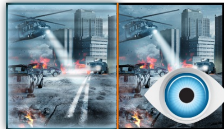
Flicker free + reductor de luz azul

La tecnología IPS ofrece un contraste más alto, negros más oscuros y ángulos de visión mucho mejores que la tecnología estándar TN. La pantalla se verá bien sin importar el ángulo desde que la mires.