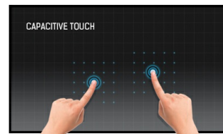
Ёмкостная сенсорная технология

IPS technology offers higher contrast, darker blacks and much better viewing angles than standard TN technology. The screen will look good no matter what angle you look at it.