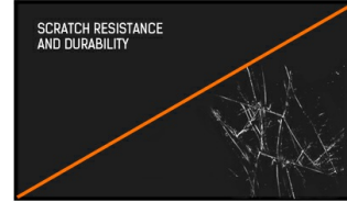
SCRATCH RESISTANCE AND DURABILITY