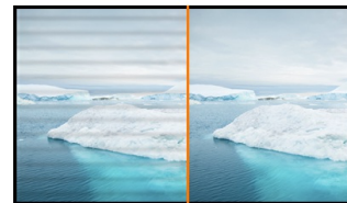
L'image sans scintillement

Socle ajustable en hauteur vous permet de définir la position idéale de l'écran en assurant un confort de visualisation optimal. Rotation de l'écran signifie que vous pouvez changer la position de l'écran de l'horizontale en verticale. Cette fonction pourrait être particulièrement appréciée lorsque vous travaillez avec des feuilles de calcul ou des textes longs.