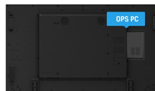
OPS PC SLOT

La technologie IPS offre un contraste plus élevé, des noirs plus sombres et les angles de vision bien meilleurs que la technologie traditionnelle TN. L'image aura l'air bien quel que soit l'angle sous lequel vous la regardez.