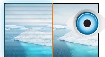
W trosce o zdrowie naszych oczu

Technologia VA gwarantuje wyższy kontrast, lepsze odwzorowanie barw i większe kąty widzenia niż najbardziej popularna technologia TN. Obraz będzie wyglądał dobrze niezależnie od tego, pod jakim kątem na niego patrzymy.