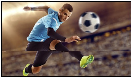
La tecnología FreeSync™

El G-MASTER GE2288HS de 22" conocido como Black Hawk es el compañero perfecto a tu lado. Resistente y confiable, hará que tus enemigos se estremezcan. Famoso por ser un cazador muy capaz, el Black Hawk, armado con la tecnología FreeSync, elimina a tus enemigos con un sorprendente tiempo de respuesta de 1 ms. Y si la oscuridad cae sobre la tierra, la función Black Tuner te permite ajustar el brillo en los tonos oscuros, mejorando los detalles en las áreas sombreadas, asegurándote de que ningún enemigo permanezca oculto. Así que inicia sesión en el mundo de los juegos, ponte los auriculares y sumérgete en tu juego favorito que se muestra con una gran claridad.