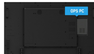
OPS PC SLOT

IPS-schermen staan vooral bekend om hun brede kijkhoeken en natuurlijke, zeer nauwkeurige kleuren. Ze zijn bijzonder geschikt voor kleurkritische toepassingen.