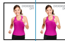
OverDrive ON / OFF

Настраиваемая по высоте подставка (HAS, Height Adjustable Stand) позволяет выбирать идеальное положение для экрана, для максимального комфорта пользователя во время работы, что не только позитивно сказывается на здоровье, но и увеличивает продуктивность труда. Возможность вращения экрана означает, что вы можете менять положение экрана: из стандартного альбомного в портретное. Это очень полезная опция, облегчающая работу с большими таблицами или текстами.