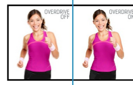
OverDrive ON / OFF

Socle ajustable en hauteur vous permet de définir la position idéale de l'écran en assurant un confort de visualisation optimal. Rotation de l'écran signifie que vous pouvez changer la position de l'écran de l'horizontale en verticale. Cette fonction pourrait être particulièrement appréciée lorsque vous travaillez avec des feuilles de calcul ou des textes longs.