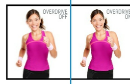
OverDrive ON / OFF

Socle ajustable en hauteur vous permet de définir la position idéale de l'écran en assurant un confort de visualisation optimal. Rotation de l'écran signifie que vous pouvez changer la position de l'écran de l'horizontale en verticale. Cette fonction pourrait être particulièrement appréciée lorsque vous travaillez avec des feuilles de calcul ou des textes longs.