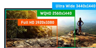
ULTRA WIDE - UWQHD

I display IPS sono noti soprattutto per gli ampi angoli di visione e i colori naturali e precisi. Sono particolarmente adatti per applicazioni critiche dal punto di vista del colore.