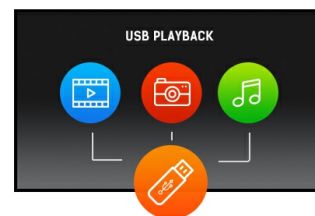
Reproducción a través de USB

La tecnología de panel SVA ofrece un mayor contraste, negros más oscuros y ángulos de visión mucho mejores que la tecnología TN. La pantalla se verá bien sin importar desde que ángulo la mires.