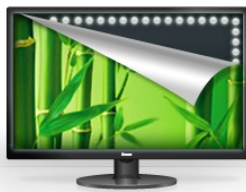
Rétro-éclairage à LED

Le 19" ProLite B1980SD, conçu pour un usage professionnel, est un moniteur avec un pied ajustable en hauteur, une image qui peut pivoter en mode "paysage" ou mode "portrait", vous assurant ainsi une parfaite ergonomie et confort de travail. Le temps de réponse de 5 ms et son haut contraste font du B1980SD un compagnon idéal pour un large éventail d'applications professionnelles. La fonction de correction du Gamma et sRGB assure les nuances de couleurs les plus précises. Le ProLite B1980SD possède des entrées vidéos VGA et DVI, et est disponible en coloris NOIR ( B1980SD-B1 ) et en BLANC (B1980SD-W1).