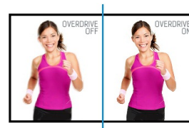
OverDrive ON / OFF

Die IPS Panel Technologie bietet einen hohen Kontrast und gute Farbbrillanz, bei einem viel größeren Einblickwinkel als bei der standard TN-Panel Technologie.