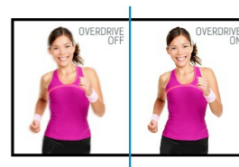
OverDrive ON / OFF

I display IPS sono noti soprattutto per gli ampi angoli di visione e i colori naturali e precisi. Sono particolarmente adatti per applicazioni critiche dal punto di vista del colore.