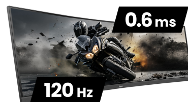
120Hz & 0.6ms MPRT

De 1500R-kromming van het scherm, garandeert een realistische en comfortabele kijkervaring, waardoor je jezelf echt kunt onderdompelen in de game.