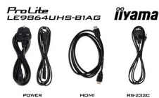
POWER HDMI RS-232C

Tutti i marchi e i marchi registrati citati. E & O E. Specifiche soggette a modifiche senza preavviso. Tutti i display LCD è conforme alla norma ISO-9241-307:2008 in connessione con difetti dei pixel. © IYAMA CORPORATION. ALL RIGHTS RESERVED