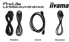
POWER HDMI RS-232C

All trademarks and registered trademarks acknowledged. E & O E. Specification subject to change without notice. All LCD's comply with ISO-9241-307:2008 in connection with pixel defects. © IIYAMA CORPORATION. ALL RIGHTS RESERVED