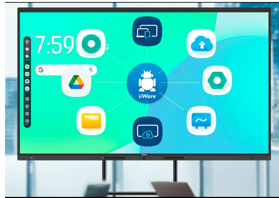
iiWare 21E (Android 14 OS)