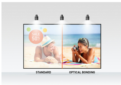
Optical bonded PCAP

De flexibele voet kan in verschillende hoeken worden geplaatst, waardoor een comfortabele en ergonomische gebruikerservaring ontstaat. Het geïntegreerde kabelbeheersysteem verbergt alle kabels en elektrische draden, waardoor een nette en kabelvrije werkruimte ontstaat. De Anti-Glare coating voorkomt hinderlijke beeldreflectie van de omgeving, waardoor de kleurweergave, het contrast en de scherpte niet worden beïnvloed. Een perfecte keuze voor een breed scala aan toepassingen, zoals interactieve toepassingen en Digital-Signage zoals instore retail, POS en interactieve presentaties.