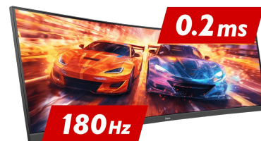
180Hz & 0.2ms MPRT

De 1500R-kromming van het scherm, garandeert een realistische en comfortabele kijkervaring, waardoor je jezelf echt kunt onderdompelen in de game.