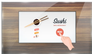
Touch durch Glas

Der Open-FraProLite TF1015MC verwendet die PCAP-Touch-Technologie und ist verbaut in einem formschönen Edge-to-Edge Glas Design. Dank seiner Glasauflage und dem robusten Rahmen garantiert der Bildschirm eine hohe Haltbarkeit und Kratzfestigkeit und ist somit ideal für Kiosksysteme und Anwendungen im öffentlichen Einsatz geeignet. Die IPS-Panel-Technologie bietet eine präzise und konsistente Farbwiedergabe mit weiten Betrachtungswinkeln. Ausgestattet mit einer Schaumstoffdichtung bietet das Gerät eine nahtlose Integration in Kiosksysteme. Mit der IP65 Zertifizierung bietet das Gerät eine Staub- und Wasserresistenz in der Bedienung. Die Ausrichtungsoptionen Quer- und Hochformat sorgen für flexible Montagemöglichkeiten. Der TF1015MC kann mit separat erhältlichen Befestigungswinkeln ausgestattet werden ( OMK2-1 ), die den Einbau erleichtern. Die ideale Lösung für Kiosksysteme, industrielle Umgebungen, Kontrollräume und interaktive Multimedia-Anwendungen.