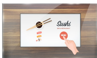
Dotkněte se skla

ProLite TF1015MC (10.1") používá PCAP dotykovou technologii a je zabudován do okuláru s bez rámečkovým šasi. Díky skleněné vrstvě kryjící obrazovku a robustnímu rámu zaručuje vysokou odolnost a odolnost proti poškrábání, takže je ideální pro kiosky a místa veřejného prostoru. Technologie panelu IPS nabízí přesnou a konzistentní reprodukci barev s širokými pozorovacími úhly. Vybavená pěnovým těsněním, podporuje bezproblémovou montáž do kiosků a zajišťuje stupeň krytí IP65, což vede k odolnosti proti prachu a vodě v přední části obrazovky. Orientace na šířku, na výšku i lícovou stranou zajišťuje flexibilní možnosti montáže téměř v jakékoli instalaci. Pro snadnou montáž a umístění je přístroj TF1015MC vybaven externími montážními držáky ( OMK2-1 ), což je ideální řešení pro integrátory kiosku, průmyslové prostředí, řídicí místnosti a interaktivní multimédia.